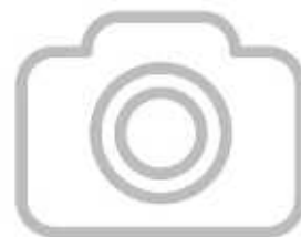
Фото временно отсутствует

Родилась в селе Дареевск. Работала огородницей в колхозе «Красный май». За добросовестный труд награждена орденом «Ленина».