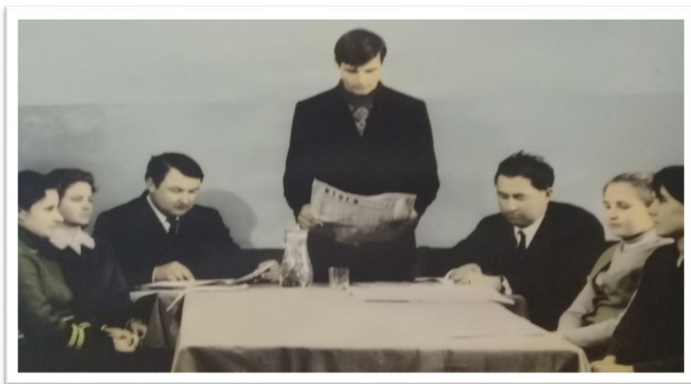
На фото идет заседание комитета ВЛКСМ колхоза «Путь Ленина»