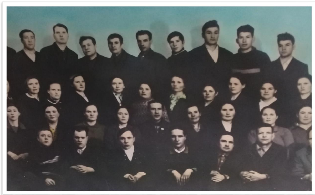
На фото труженики МТФ