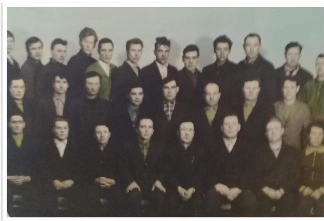
На фото труженики МТП