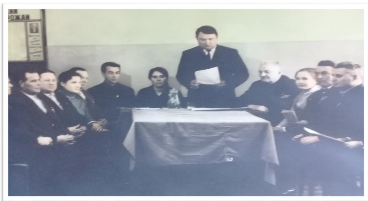
На фото идет заседание правления колхоза «Путь Ленина»

В 1989 году в связи с разукрупнением хозяйств на основании решения Брянского облисполкома №119 от 09.03.1989 г. и решения общего собрания колхозников (Протокол №1 от 15.03.1989 г.) колхоз «Путь Ленина» был разделен на два хозяйства: колхоз «Савостьяновский» с населенными пунктами с. Савостьяны и пос. Красный Октябрь с центральной усадьбой в селе Савостьяны и колхоз «Путь Ленина» с центральной усадьбой в деревне Долботово. Колхоз имел растениеводческое и животноводческое направления и занимался производством, переработкой и реализацией сельхозпродукции. В связи с ликвидацией в 2007 году колхоза «Савостьяновский» дела села Савостьяны и поселка Красный Октябрь были переданы на хранение в районный архив.