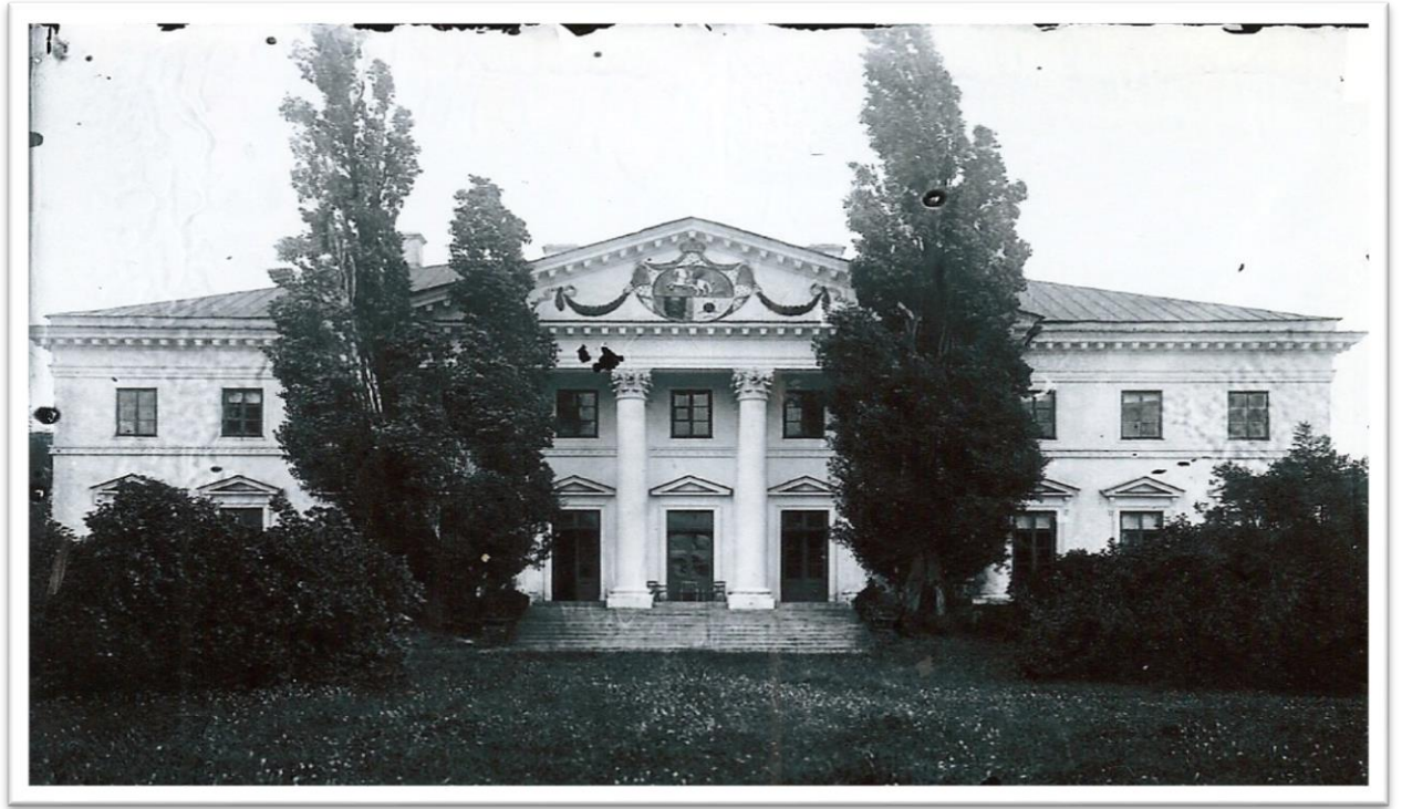
Дом И.А. Безбородко в начале 19 века.