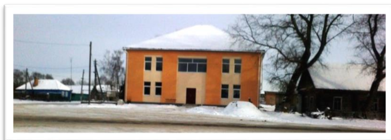
Восстановленное административное здание.

В 1974 году запустилась в эксплуатацию новая ферма. Ферм было четыре. На центральной, что в селе Гринёво были коровы, лошади, куры, на Барынках – свиньи, на Натальином хуторе - овцы. На Низах была полноценная ферма, где кроме коров были и другие животные. А также в селе имелись мельница и тракторный стан. Открывалась на селе небольшая автономная установка для выработки электроэнергии. Свет населению подавался с 18 до 24 часов. Открылся свой радиоузел. В 1958 году было построено сельское потребительское общество (СПО). В 1987 году открывается детский сад. Построено новое административное здание колхоза.