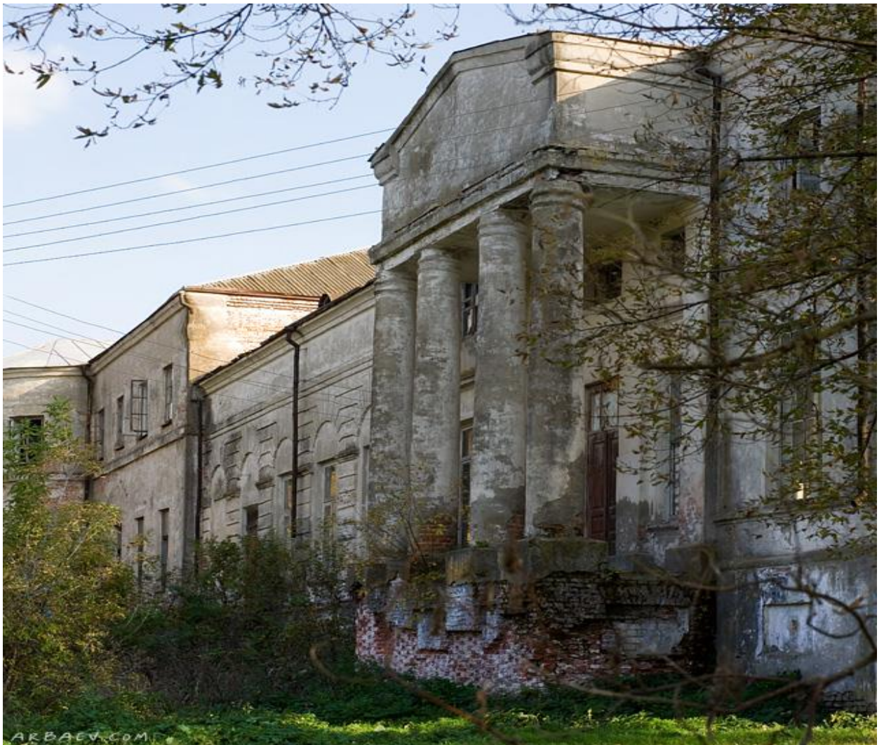
Дом И.А. Безбородко в начале 21 века.