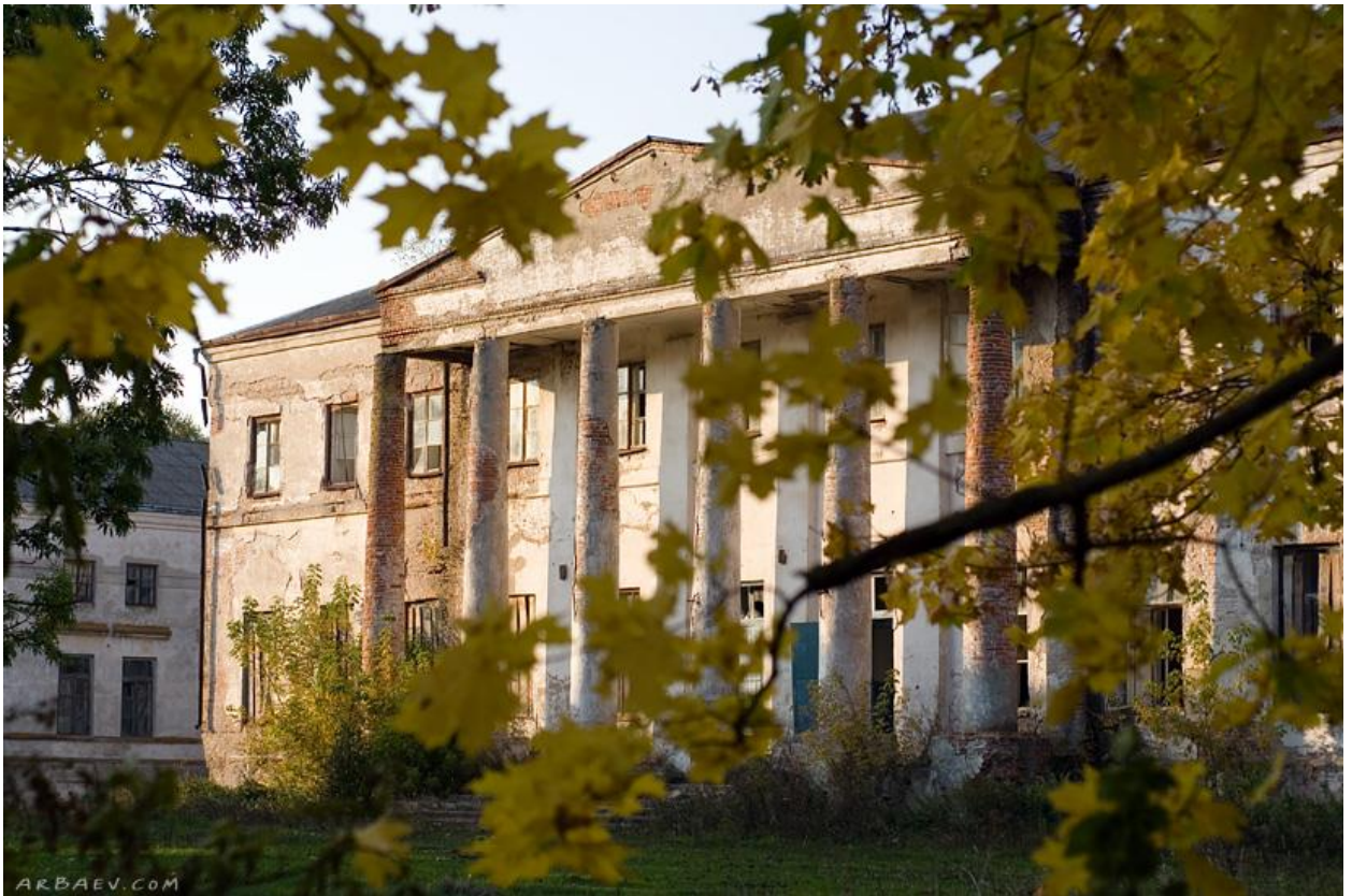
Дом И.А. Безбородка так выглядит сейчас.