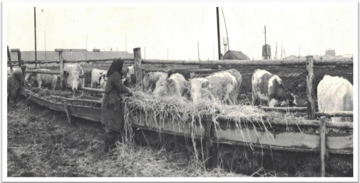
Открытая площадка для откорма телят совхоза «Чеховский»