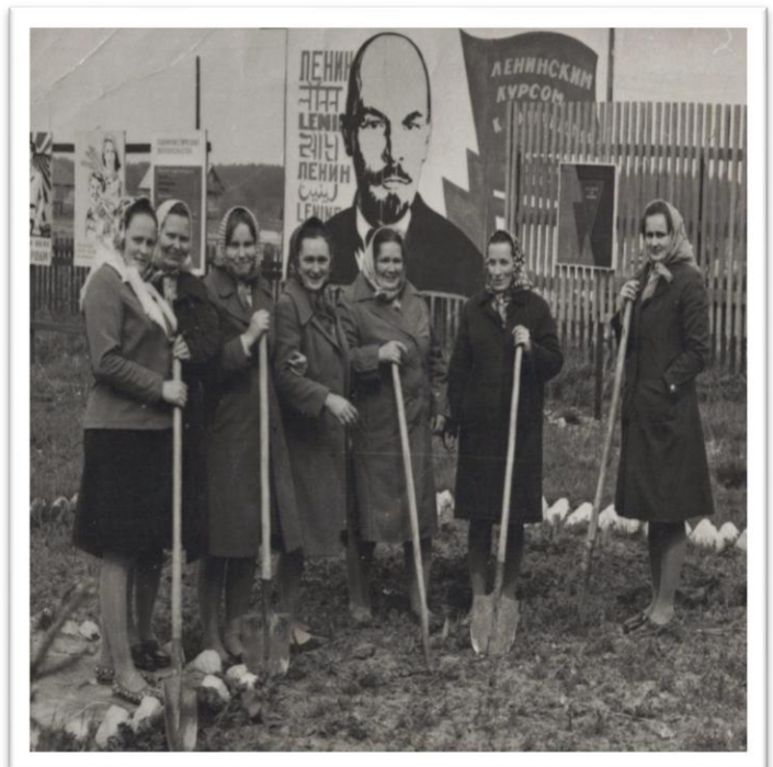
На фото сотрудницы конторы совхоза «Чеховский»