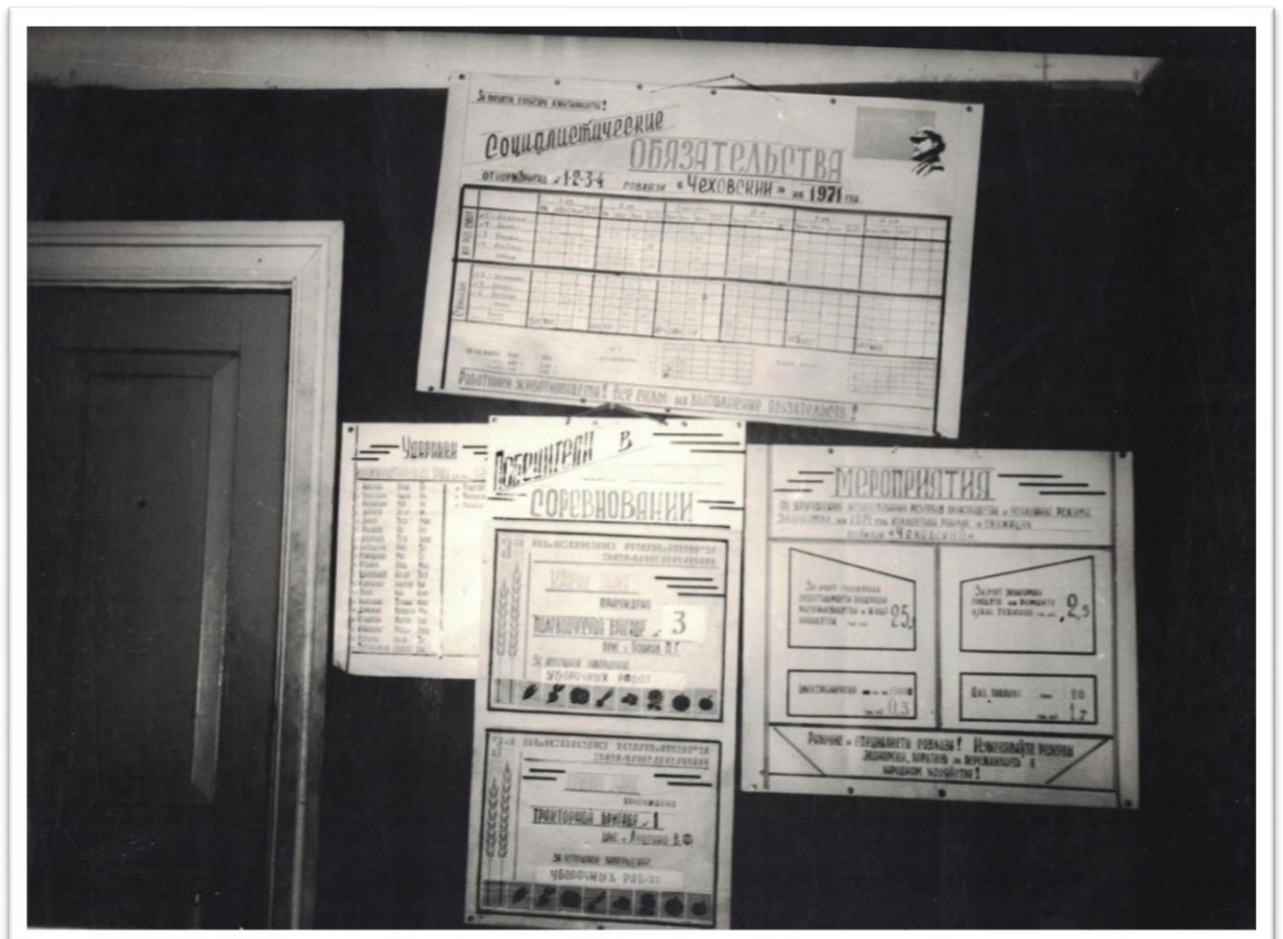
На фото доска объявлений - здесь есть социалистические обязательства совхоза «Чеховский», названы ударники производства и победители соцсоревнований.